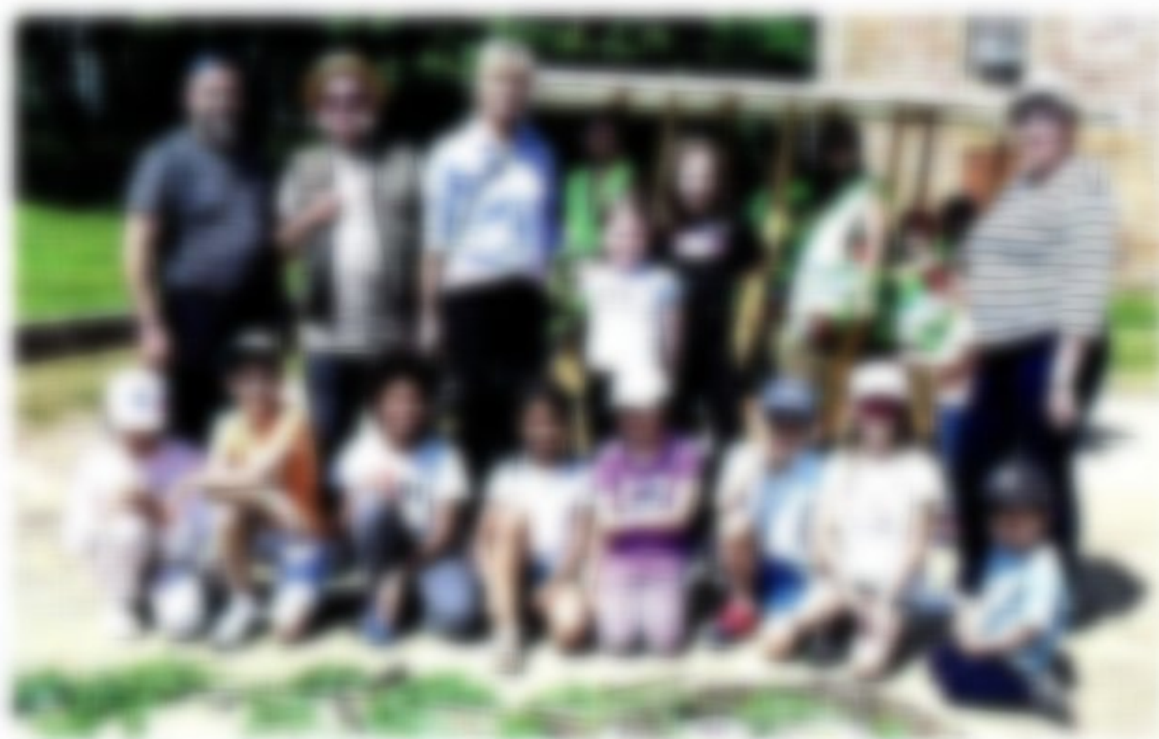
L'initiative au local est, une conception collective en lien avec la nature.

Aux programmes : un atelier de partage des bons, locaux et de saison, des ateliers d'art éco-citoyen, « Autour de l'eau » par le Comité permanent d'habitants pour l'environnement, découverte des végétaux, mais aussi la fabrication de sachets avec le club ornithologique de Charnay-Léviot, un quiz sur la faune, des contes et histoires autour du thème de la nature par la bibliothèque pour tous, la présentation du Village et le programme d'accessibilité au