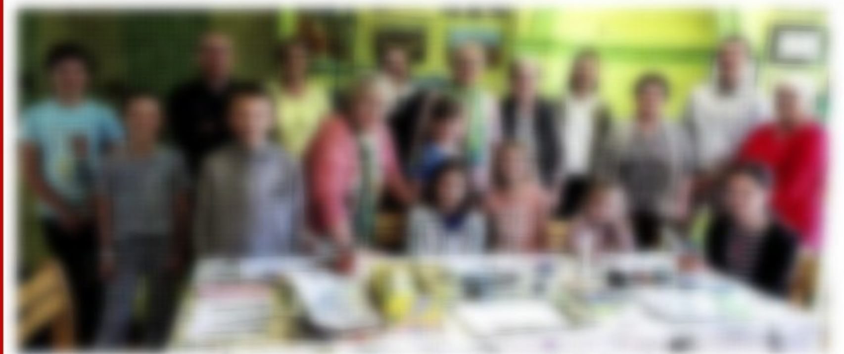
Depuis quatre décennies, l'équipe de la bibliothèque municipale partage avec petits et grands le plaisir de lire et la passion des mots.

La bibliothèque municipale a fêté ses 40 ans samedi en grand succès.